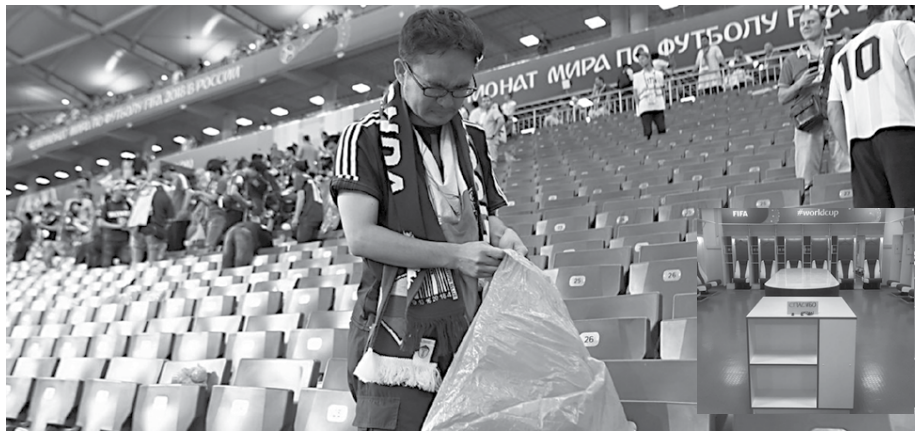
Torcedores japoneses limpam as arquibancadas e deixaram fervorosamente contra a Bélgica, que venceu o jogo por 3 a 2. No detalhe, o vestiário totalmente limpo pelos jogadores após o jogo

Mesmo assim, após o jogo, a torcida pegou os sacos para lixo que tinha levado e limpou as arquibancadas, enquanto os jogadores deixaram o vestiário impecavelmente