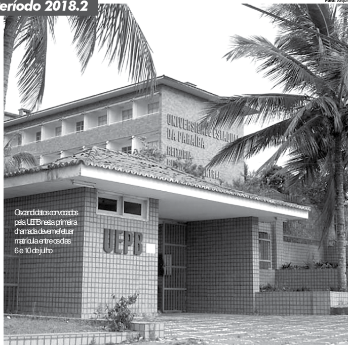
Candidatos convocados pela UEPB nesta primeira chamada devem efetuar matrícula entre os dias 6 e 10 de julho