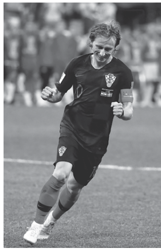
Modric diz que seria incrível levantar a taça como capitão da equipe