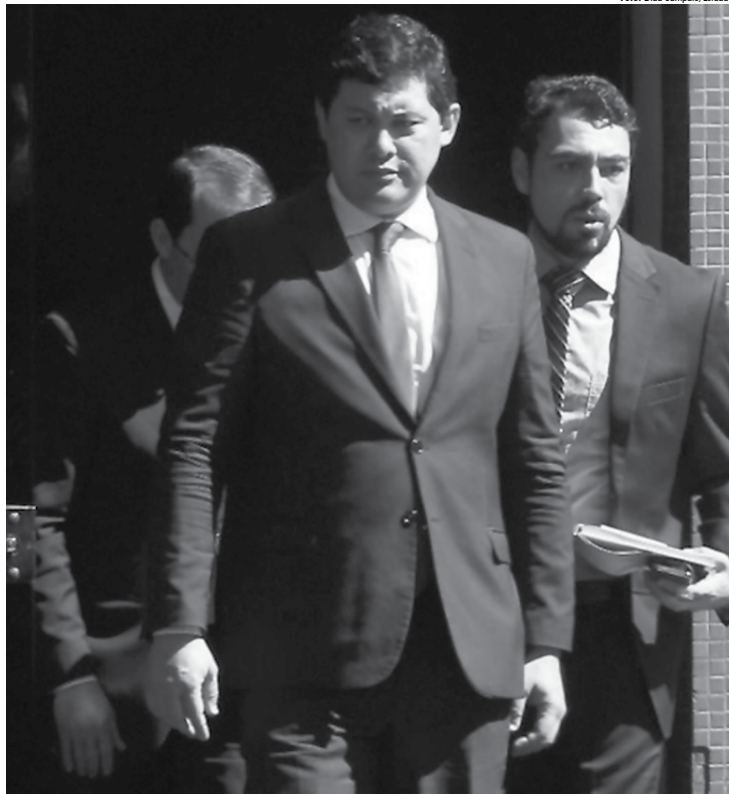
Ex-ministro do Trabalho, Helton Yomura, foi à sede da Polícia Federal, em Brasília, para prestar depoimento antes de pedir demissão do cargo

O governo chegou a recorrer, mas o PTB desistiu da indicação da deputada, em fevereiro. Yomura, então, foi a solução encontrada pelo PTB e permaneceu no comando do ministério.