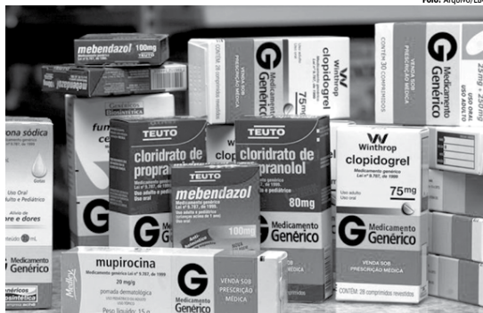
Genéricos correspondem a mais de 70% das 4,3 bilhões de unidades farmacológicas produzidas no país